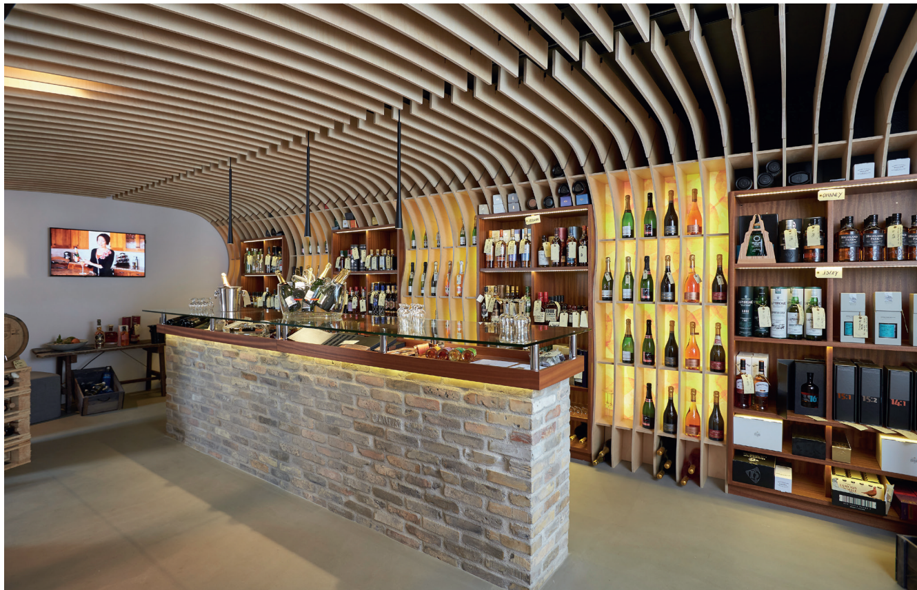
Lofter og vægge i butikken Vin & Velsmag går i spænd med inventar, salgsdisplays osv.

Art Design har i næsten 30 år leveret skræddersyede, salgsfremmende løsninger til butikker og har løbende udvidet maskinparken for at dække efterspørgslen på avancerede design inden for displays og inventar.