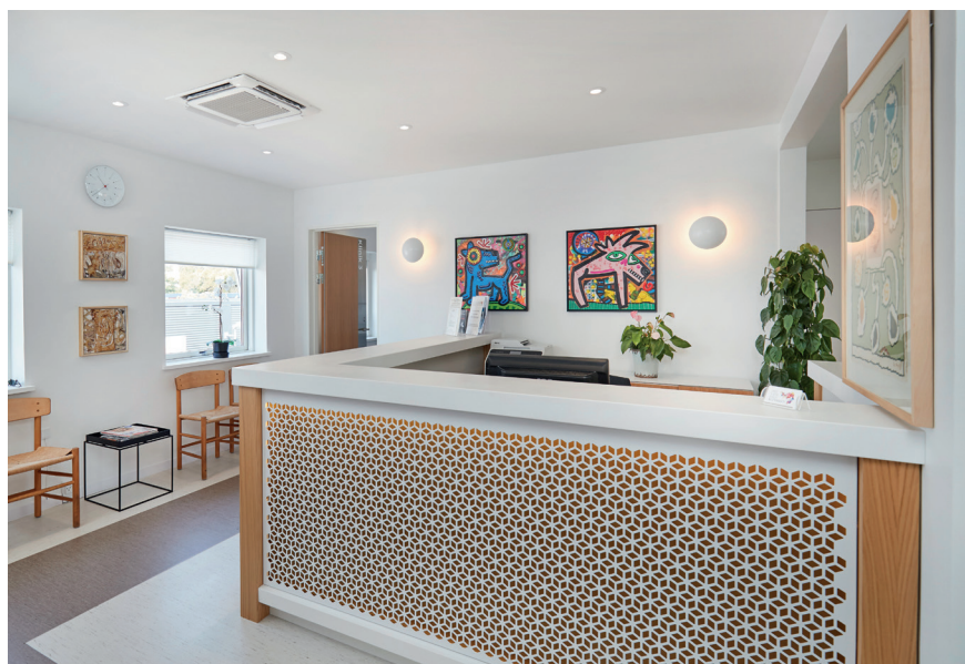
Komplette løsninger til for eksempel lægeklinikker er et nyt område for Art Design.

forkromet virksomhedsplan dengang, var det hele nok ikke blevet til noget. - Men det gjorde jeg heldigvis ikke, og vi er jo nået rigtig langt i dag.