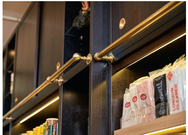
Der arbejdes i alle materialer som her i Cigar Shop Macanudo Copenhagen.

Denne maskine styres af Maestro Active samt Maestro CNC 3D-Advanced og Maestro Pro View.