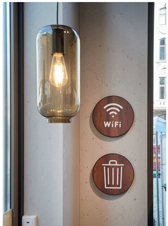
Der gøres meget ud af de små detaljer.