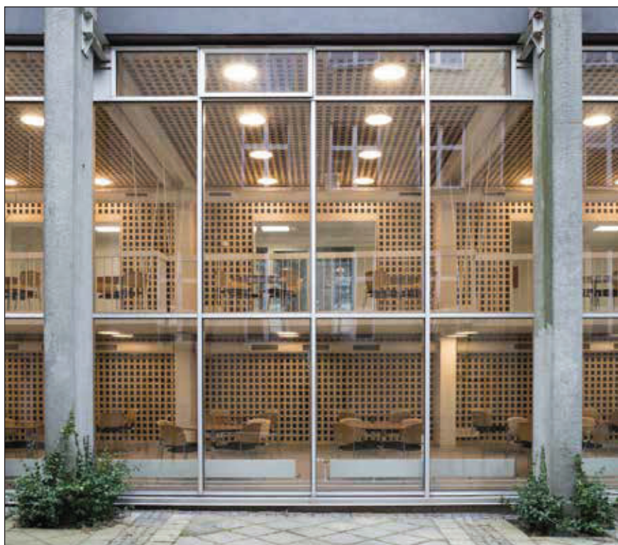
Akustikvægge som her på Aarhus Universitet er et hurtigt voksende område.